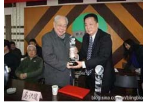
2012年,冰凌在成都向四川省人大常委會原副主任、四川省作家協會主席、99歲著名老作家馬識途先生頒發首屆美國東方文豪終身成就獎。