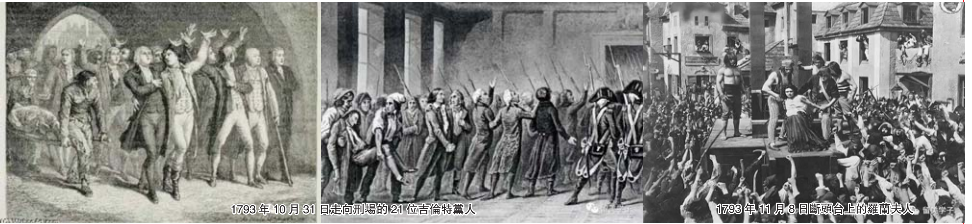
1793年10月31日走向刑場的21位吉倫特派黨人