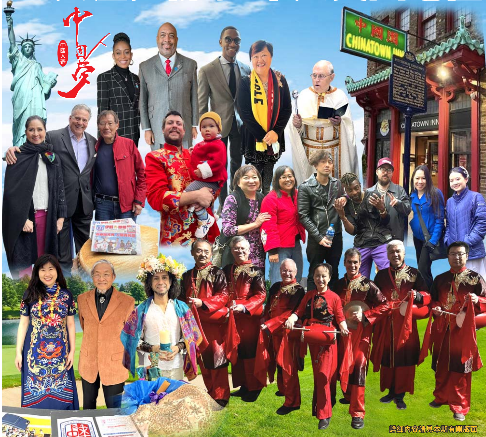
詳細內容請見本期有關版面