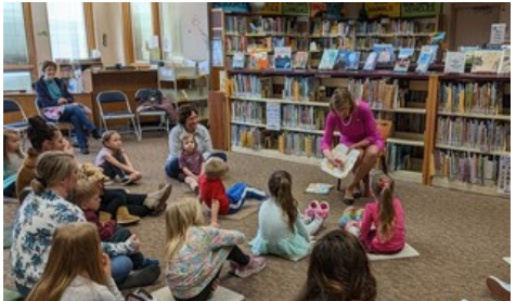
First Lady DeWine talks about the progress at the Ohio Governor's Imagination Library during the Wooster Rotary meeting.

Lt. Governor Husted also visited Whirlpool Corporation at their Findlay location on Monday to tour the facility and join a roundtable discussion on Ohio's manufacturing industry. The group discussed the importance of Ohio's manufacturing industry and workforce programs, like Tech Cred.