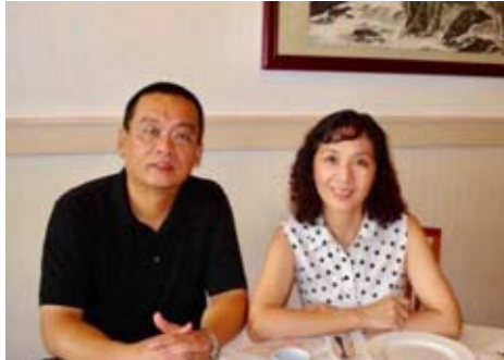
2006年,旅居美國近二十年的著名電影演員龔雪女士(右)回國定居。全美中國作家聯誼會在康州舉行歡送宴會,冰凌採訪了龔雪女士,寫了專訪《龔雪說:我回家了》,發在中國新聞網上。