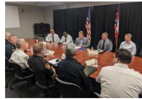
Lt. Governor Husted speaks with law enforcement officials at the Ohio State Highway Patrol's Brook Park HQ in Northeast Ohio.

Previously headquartered in Melville, New York, FlightSafety officially made Columbus home in late 2021. The new 35,000-square-foot facility will support long-term growth, talent recruitment and workforce retention in the Columbus region.