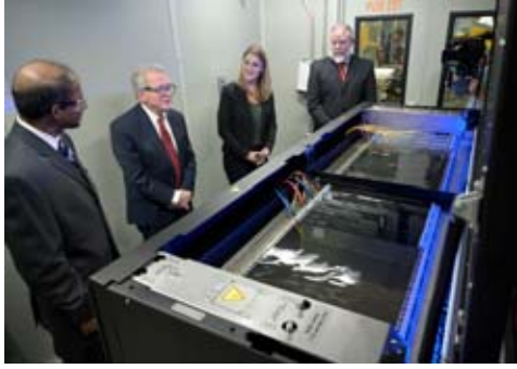
Governor DeWine tours the Lubrizol Corporation in Cleveland.

Governor Mike DeWine was in Lake County Monday afternoon where he met with representatives of the Lubrizol Corporation and toured their research and development campus. Lubrizol is one of many corporations throughout Ohio that are collaborating with Intel, which recently announced a $20 billion investment to create a semiconductor chip manufacturing facility in central Ohio. The two companies are collaborating to test and commercialize immersion fluid for data center thermal management