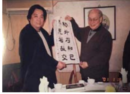
2001年,冰凌應邀訪問四川省作家協會,四川省人大常委會副主任、四川省作家協會主席、電影《讓子彈飛》原作者、87歲著名老作家馬識途先生(右)向冰凌贈送珍貴書法精品。