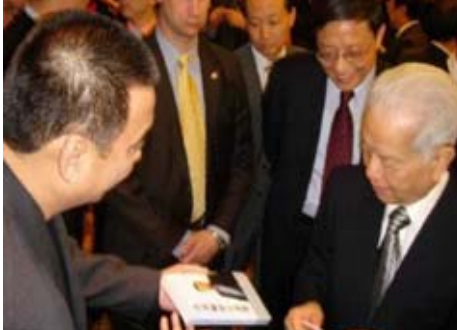
先生(右一)贈送《冰凌幽默小說選》。右二為中國駐美大使周文重先生。