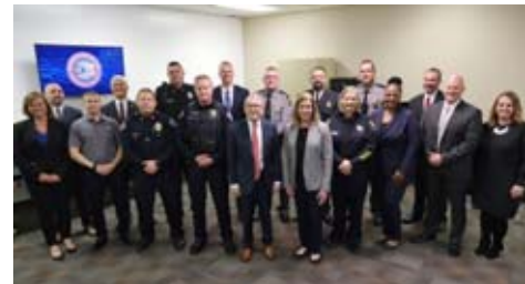
Governor DeWine pictured with law enforcement officers and employees at the new Ohio Narcotics Intelligence Center.

She also toured Elizabeth's Hope Pregnancy Resources and thank workers for referring clients to the Ohio Governor's Imagination Library.