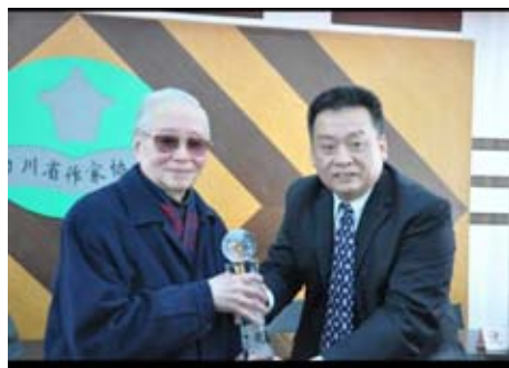
身成就獎。2012年,冰凌在成都向茅盾文學獎獲得者、89歲著名老作家王火先生(左)頒發首屆美國東方文豪終身成就獎。