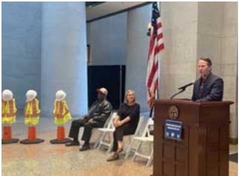
Lt. Governor Husted speaks at the National Work Zone Safety Awareness Week kick-off event at the Ohio Statehouse.

Governor Mike DeWine was in Lake County Monday afternoon where he met with representatives of the Lubrizol Corporation and toured their research and development campus. Lubrizol is one of many corporations throughout Ohio that are collaborating with Intel, which recently announced a $20 billion investment to create a semiconductor chip manufacturing facility in central Ohio. The two companies are collaborating to test and commercialize immersion fluid for data center thermal management