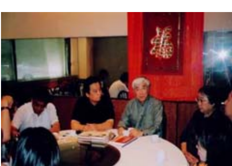
2005年,全美中國作家聯誼會在紐約萬壽宮飯店舉行記者招待會和歡迎宴會。冰凌邀請中國著名作家、劇作家蘇叔陽先生(中)介紹中國文學事業發展的偉大成就。