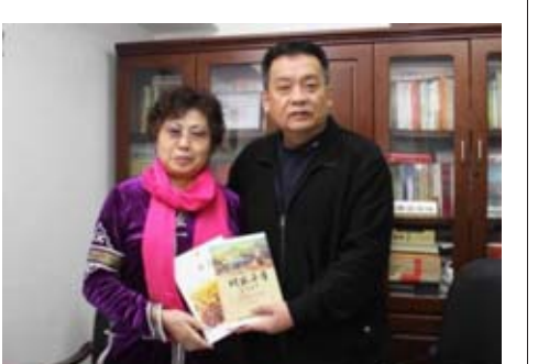
2014年,冰凌電視工作室邀請著名蒙族詩人薩仁圖雅女士(左)前來杭州拍攝《中國著名作家電視訪談錄》(薩仁圖雅卷)。