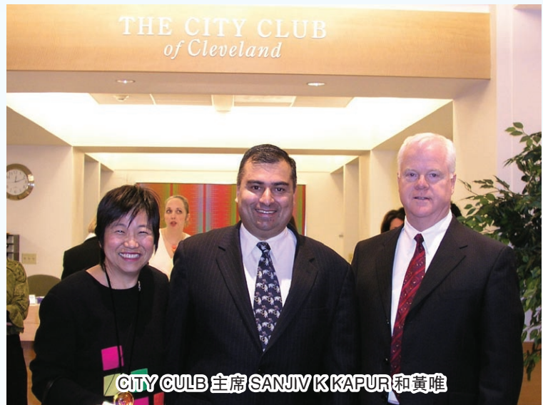
CITY CLUB 主席 SANJIV KAPUR 和黃唯

1953 年出生於中國台北，祖籍上海嘉定。1963 年隨父母移居美國。1975 年畢業於美國曼荷蓮女子學院，主修經濟。1979 年獲得美國哈佛大學企業管理學院碩士學位。1983 年成爲 13 名「白宮實習生」中唯一的華裔女性。1984 年任舊金山美國商業銀行國際金融副總裁。1986 年棄商從政，任美國聯邦政府交通部航運局副局長。1989 年任交通部副部長，系當時華裔在美國聯邦政府內級別最高的官員。1993 年與美國聯邦參議員米切爾·麥康納結婚，有三名子女。喜歡高爾夫球、騎馬和鋼琴。1996 年當選全美六大杰出婦女和全美十大杰出女青年。2002 年出任布什內閣勞工部長，成爲美國歷史上第一位華裔內閣部長。2004 年任美國聯合基金會名譽主席。2005 年出任新政府副總理，再次出任勞工部長。