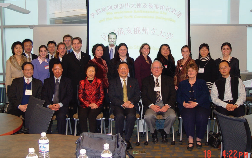
圖：劉總夫婦與學習中文的部分美國學生及東亞系老師合影留念

2006 年 1 月 18 日，劉碧偉總領事夫婦一行訪問了俄亥俄州立大學，代表中國政府向該校贈送 1 千餘冊圖書。下午劉總與該校東亞系部分學習中文的美國學生和老師舉行了座談。劉總向同學們介紹了中國經濟建設和發展的有關情況，并就中美關係、臺灣、西藏、人權等問題以及如何到中國工作和學習等回答了學生們的提問。這些同學是美國國家漢語旗艦工程第一期碩士班的學生。該工程由吳偉克 (Gal Walker) 教授創建并任主任。它致力於培養精通漢語和文化的專業人才，旨在培養學生將來到中國工作。它特別重視文化交流，強調文化演練 (知行合一)。在座談中，同學們流利的漢語，對中國文化的了解以及將來到中國工作的熱情，給劉總領事夫婦一行留下了深刻的印象。會後大家合影留念。劉總并邀請該項目的同學及老師在適當的時候去紐約總領館做客。(網站: http://chinese-flagship.osu.edu )