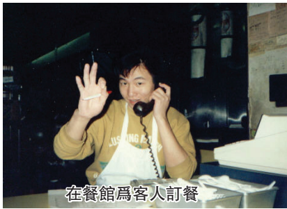
在餐館為客人訂餐