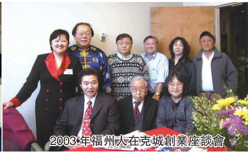
2003年福州人在克城創業座談會