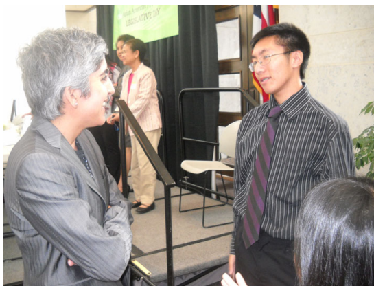
(Akron, Cincinnati, Cleveland, Columbus, Dayton 及 Toledo)超過 500 位來自不同國家的民眾參加活動

Tuesday, June 8, 2010, 11 am - 3pm Columbus State House - Atrium