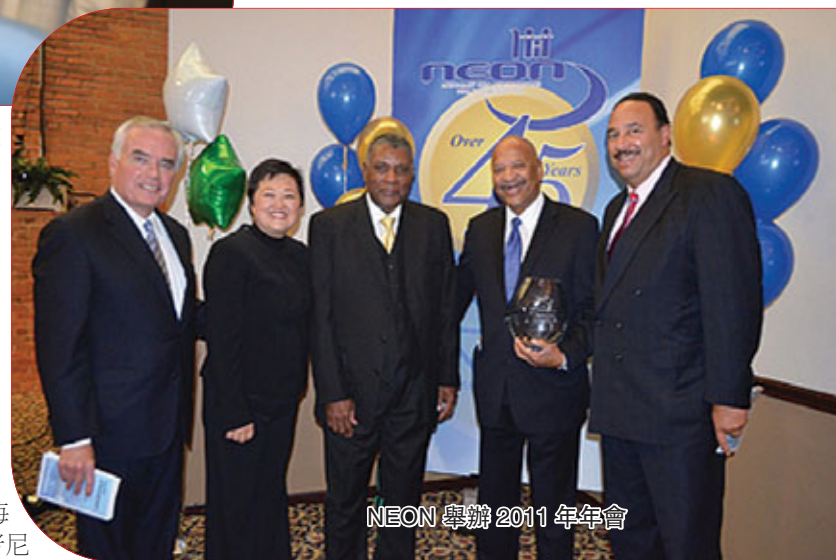
NEON 舉辦 2011 年年會

今天,NEON 更強烈的希望把這份真誠與服務帶入亞裔和華人社區,為亞裔華人提供一個親近的,家庭式的醫療服務環境。尼昂承諾,無論過去,現在和未來,尼昂會本着以服務克利夫蘭大區居民對健康的需求為根本,為更多的患者提供更人性化,更高品質的