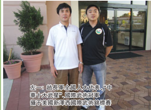
左一：趙長軍全國人大代表、“中華十大武星”、國際武術冠軍。攝于美國新澤西國際武術錦標賽

工作的三年里,他極大推動了北美武術的發展,帶領出一批優秀有潛力的運動員,讓美國的武術運動員水平得到顯著提陞。在他工作期間培養出了六名美國武術國家隊成員,其中 Gina Bao (吉娜·包)代表美國國家武術隊參加了在中國舉辦的“第五屆世界武術傳統錦標賽”,並獲得太極劍的世界冠軍。多名學員在美國舉辦的“國際中國武術錦標賽”中共取得幾十枚武術冠軍金牌。2011