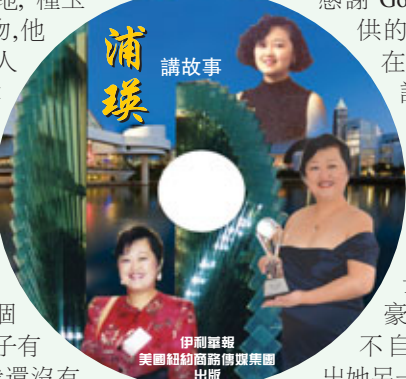
伊利華報 美國紐約商務出版集團 出版

當人沒有了善良，當人沒有了尊嚴，當人被貪欲佔據了，不知道等待的是如何的人生。不過當我看著他們兩人手牽手離開，看著他們的背影消失在我眼前，我感恩他們讓我明白一個道理：什麼是真正富有的人：一個慈悲捨得的人，一個真誠有德性的人，一個無貪欲有尊嚴的人，一個能戰勝自己的人就是最富有的人。