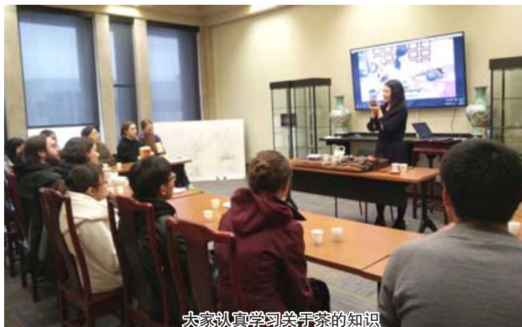
大家认真学习关于茶的知识

的不仅是对茶叶本身的知识，更是文化方面的认知。活动结束后，大家都表示中国的茶太好喝了，有人最喜欢西湖龙井，有人说要去买大红袍回家喝，教室里的茶香也久久萦绕着，没有飘散。（供稿：丁笑丛）