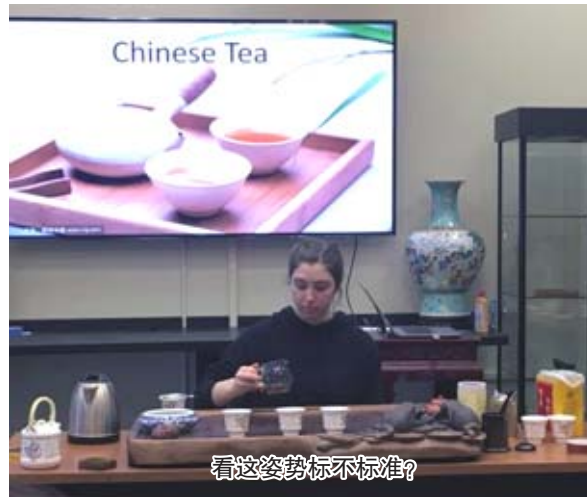
看这姿势标不标准?