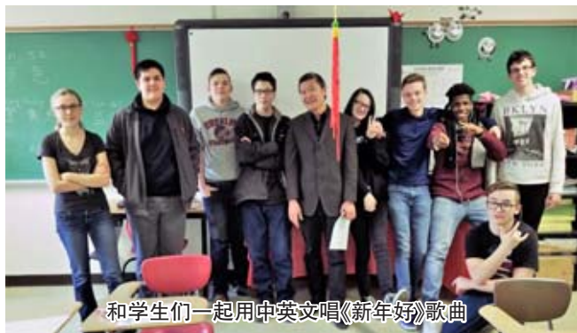
和学生们一起用中英文唱《新年好》歌曲