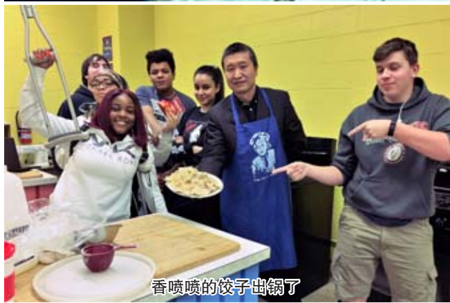
香喷喷的饺子出锅了