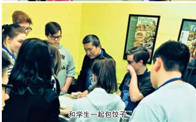
和学生一起包饺子