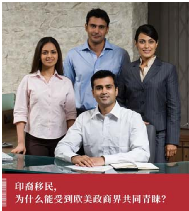
印裔移民,為什麼能受到歐美政商界共同青睞?

為什麼海外的印裔比華裔混得好?好到有一天,印度人會一統世界嗎?諸葛亮說的是,在《出師表》中開篇即,“先帝創業未半而中道崩殂,今天下三分”。意思就是萬一拜登總統不幸成了先帝,印度裔的哈里斯就即位了;若再加上印度的莫迪,和當紅炸子雞印度裔的英國首相蘇納克,就是“天下三分”了。天下就被三位三哥三姐分了,“天下三分”。