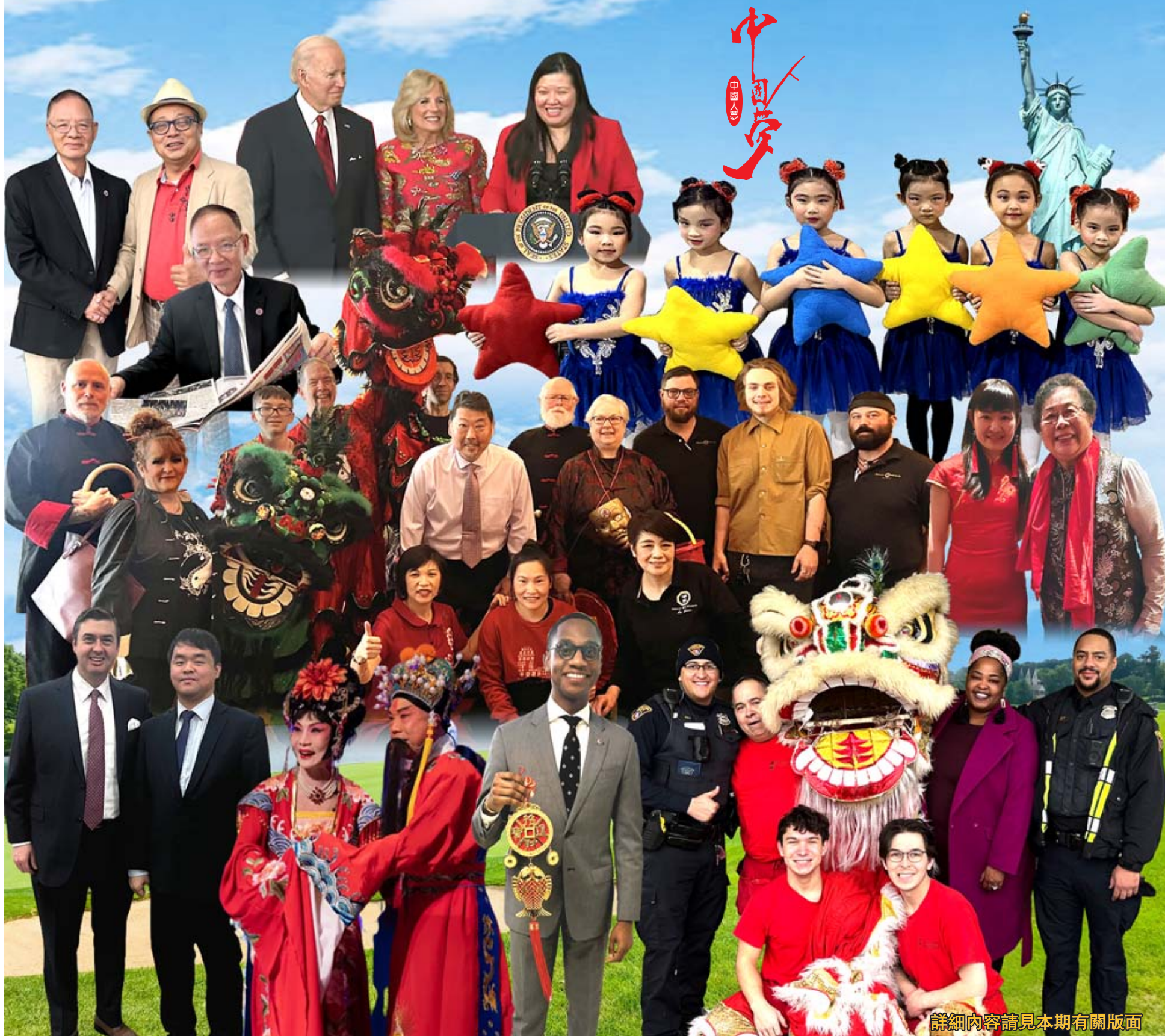
詳細內容請見本期有關版面