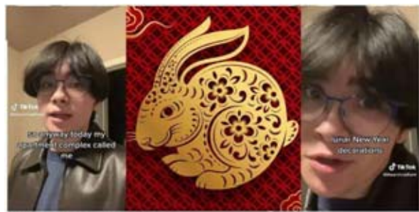
“What about all the Christmas wreaths?” Tenant says apartment management told him to remove Lunar New Year decorations