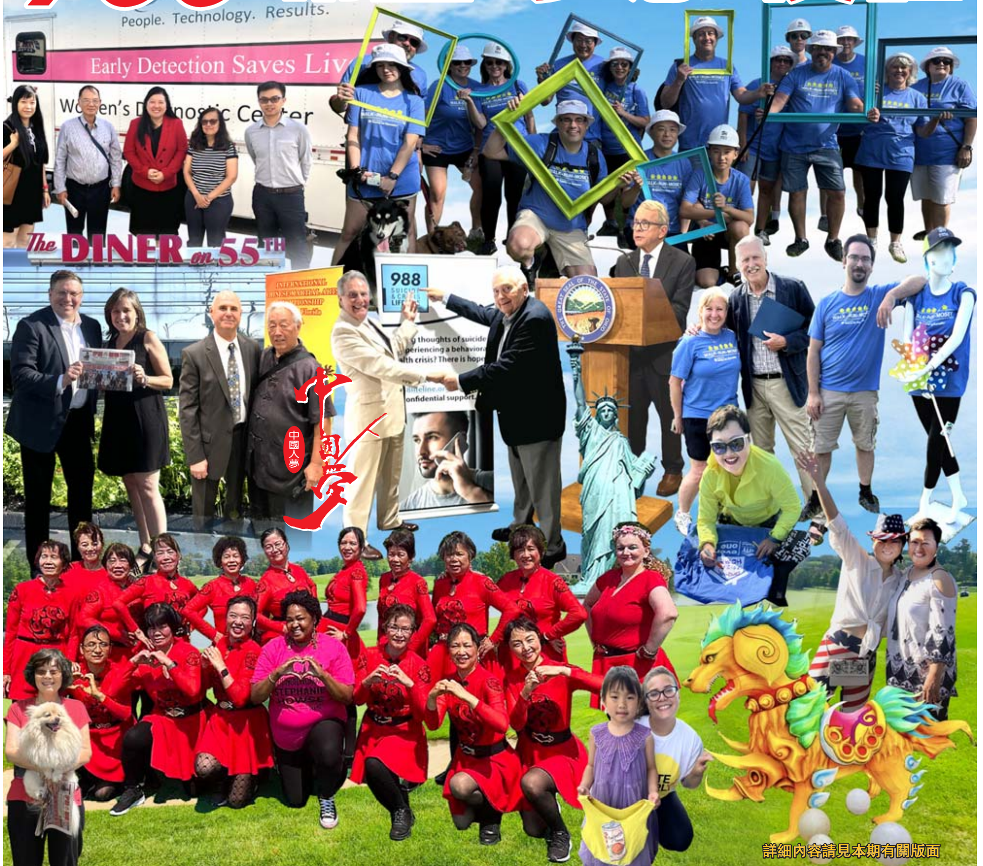
詳細內容請見本期有關版面