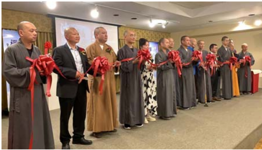
會、福田文教基金會,並開創了紐約法王寺、松林寺、慈航精舍等佛教機構,在美國華人佛教史上享有顯著地位。

與傳記發布會同時,在紐約世界日報文化藝廊舉辦了名為《法傳滄瀛—妙峰長老禪意書法展》的特別展覽。妙峰長老自上世紀六十年代來到美國,創辦了中華佛教