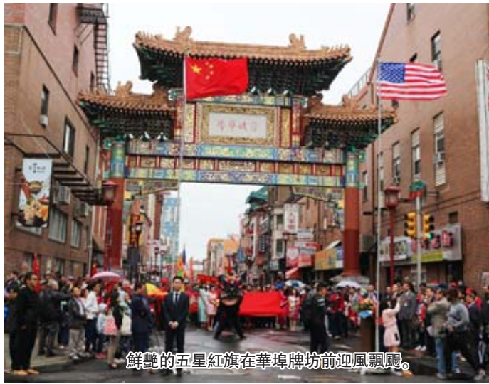
鮮豔的五星紅旗在華埠牌坊前迎風飄揚。

【僑報訊】9月23日,爲慶祝中華人民共和國成立74周年,大費城僑學界華人社團聯席會議(下簡稱僑學界)在華埠舉行昇旗儀式,中國駐紐約總領館副總領事吳曉明、僑務副主任殷民俊一行,各僑團、學生學者聯誼會、政府官員到場,與現場數百名華人華僑一起,用最真誠、最熾熱的情感向祖(籍)國深情告白,祝福祖(籍)國生日快樂,中美友誼長存。