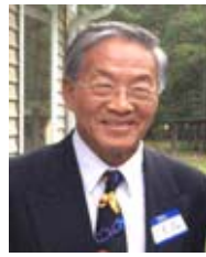
匹茲堡華人老朽 海老 KK