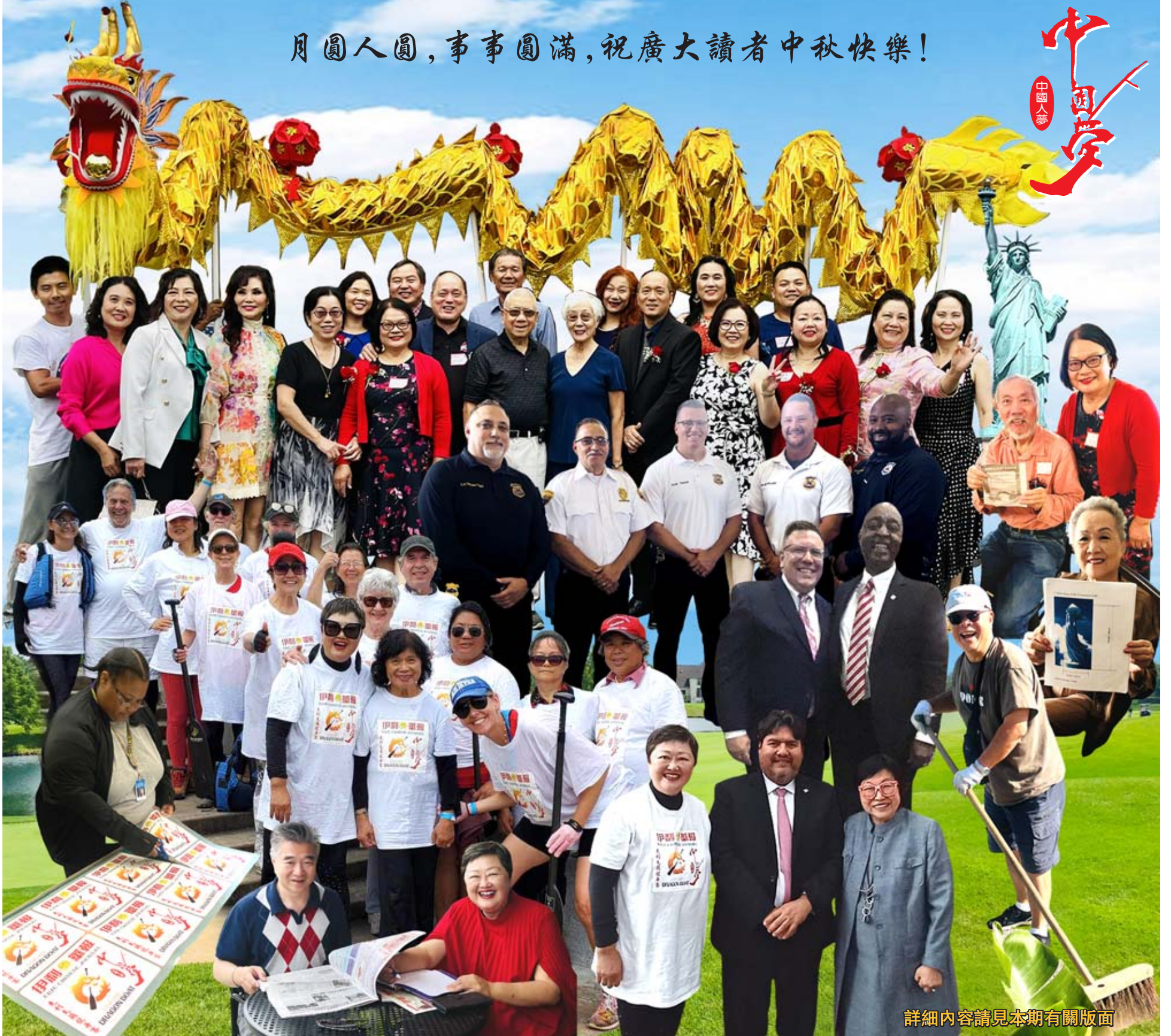
詳細內容請見本期有關版面