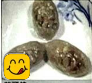
芋頭餃 Taro Dumpling