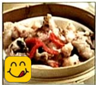
豉汁排骨 Steamed Spare Ribs