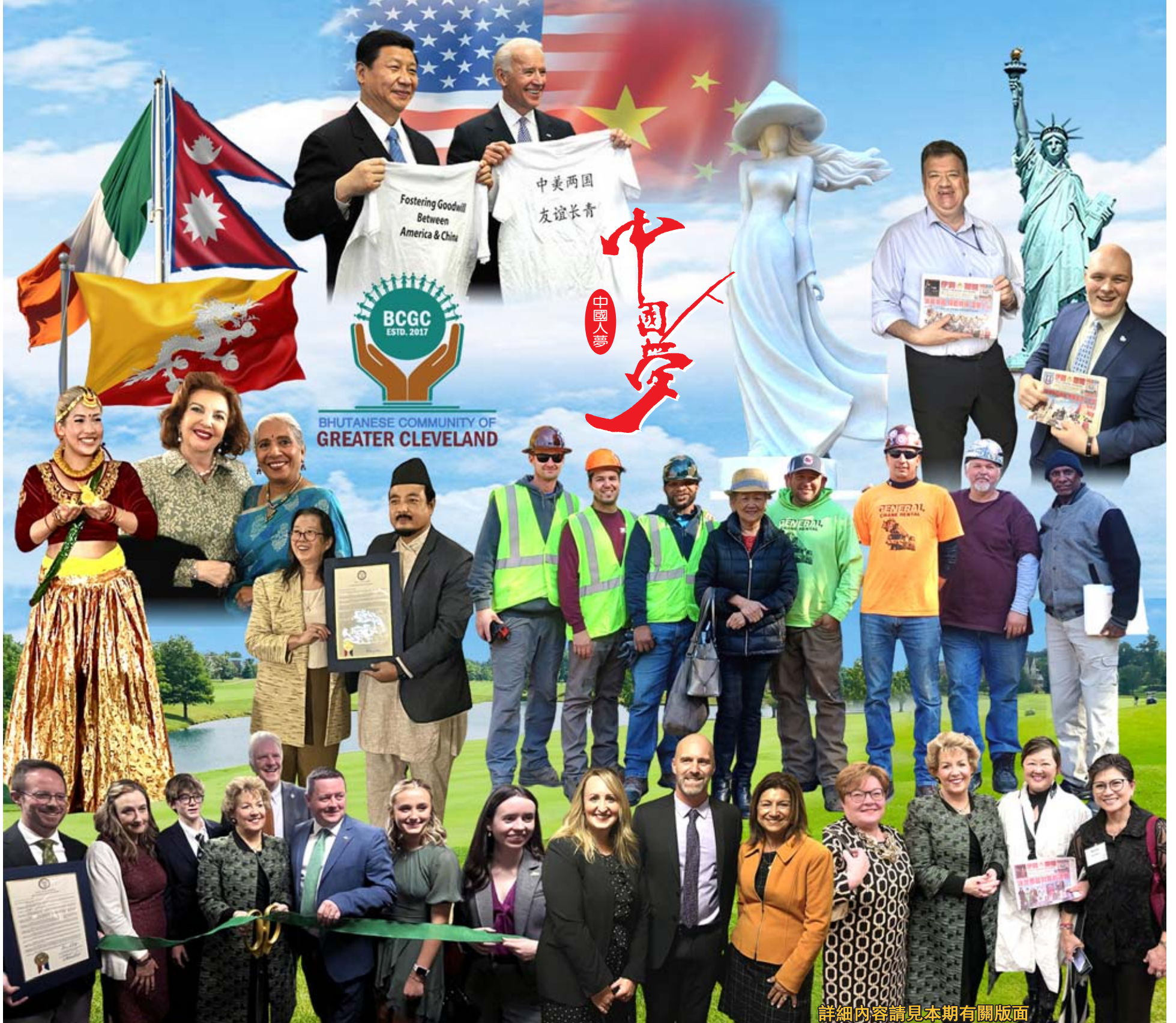
詳細內容請見本期有關版面