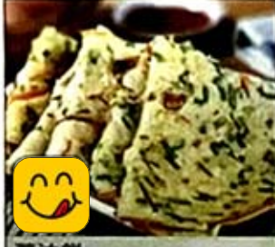
蔥油餅 Scallion Pancake