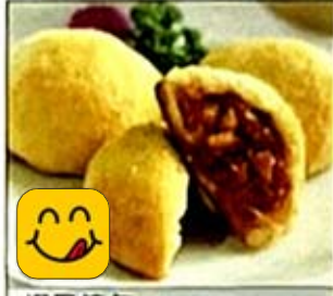
焗叉燒包 Baked BBQ Pork Buns