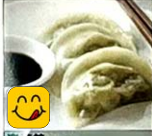
素菜餃 Vegetable Dumpling