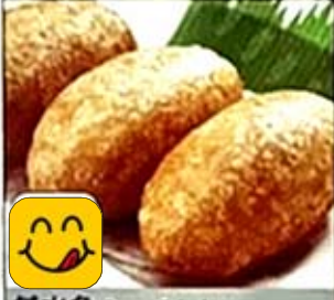
鹹水角 Savory Pork Dumpling