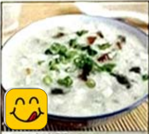
皮蛋瘦肉粥 Congee w. Preserved Egg & Pork