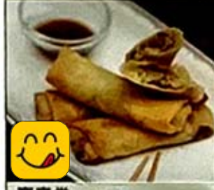
齋春卷 Vegetarian Spring Rolls