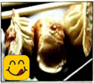
鍋貼 Pot Stickers