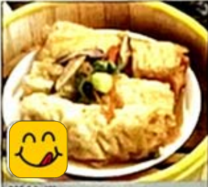
鮮竹卷 Skin Roll w. Meat & Shrimp