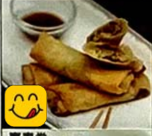
齋春卷 Vegetarian Spring Rolls