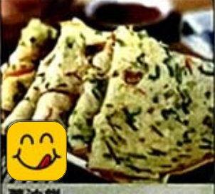
蔥油餅 Scallion Pancake