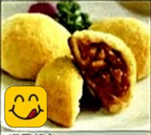
焗叉燒包 Baked BBQ Pork Buns