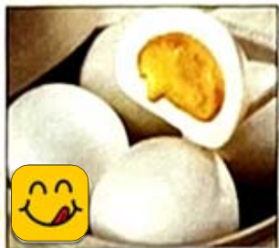
流沙包 Sweet Juicy Buns