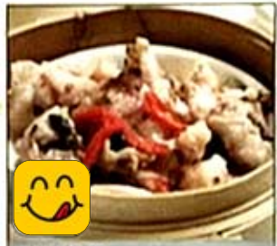
豉汁排骨 Steamed Spare Ribs