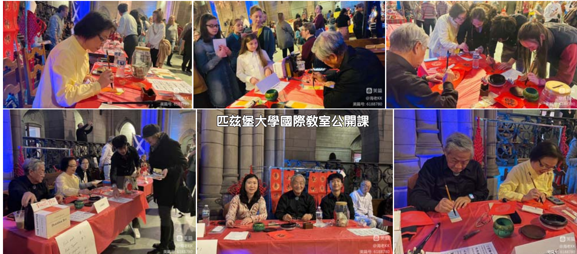
匹茲堡大學國際教室公開課

注： 傲舟~出租的船。 銀幾兩~多少錢。 2023年12月10日于維羅納阿拉根尼河