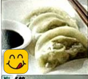
素菜餃 Vegetable Dumpling