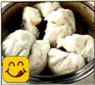
蒸叉燒包 Steamed BBQ Pork Buns