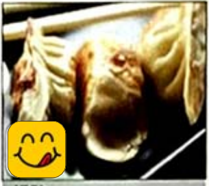
鍋貼 Pot Stickers