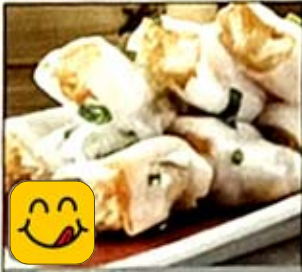
炸兩蒸腸粉 Crispy Bread Rice Noodle Rolls