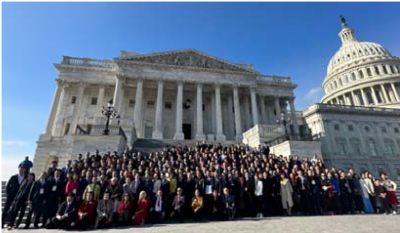
原標題:促進社會進步暨廢除排華法律 80 周年紀念大會(CRCEA80)

初冬華府,寒風漸起,晴空萬里,來自全美 26 個州的超過 400 的美國華人社區的領袖、熱心人士和義工們,意氣風發,熱情高昂,齊聚於國會山莊隆重舉行廢除排華法律 80 周年的紀念大會。