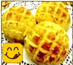
焗菠蘿包 Baked Pineapple Buns