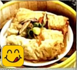
鮮竹卷 Bean Curd Skin Roll w. Meat & Shrimp