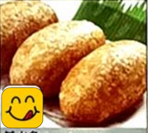
鹹水角 Deep Fried Savory Pork Dumpling