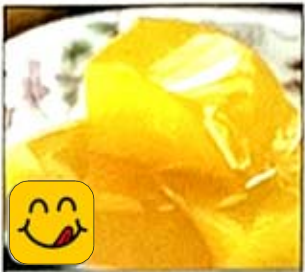
芒果布丁 Mango Pudding