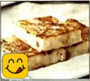
蘿蔔糕 Turnip Cake