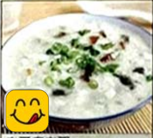
皮蛋瘦肉粥 Congee w. Preserved Egg & Pork