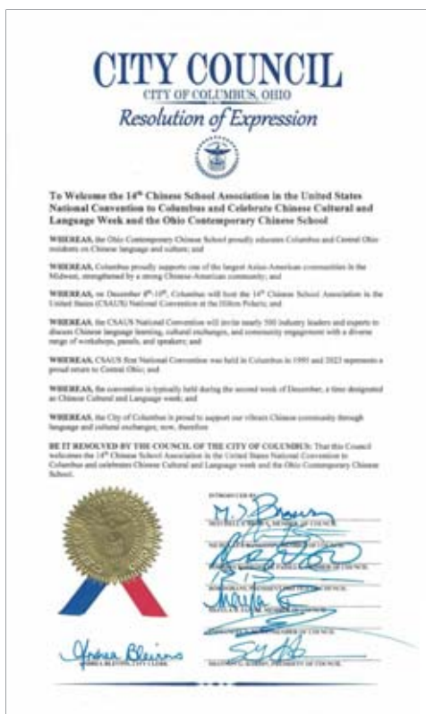
哥倫布市議會宣布大會召開的日期為中國文化和語言周

美各地近五百多所會員學校、十多万名各族裔青少年學生和八千多名教師竭誠服務。如今，全美中文學校協會已經發展成一個具有強大凝聚力、有成熟運作經驗、有著與美國、中國乃至其它國家和地區華文教育組織廣泛聯繫的全國性的超大型教育組織。