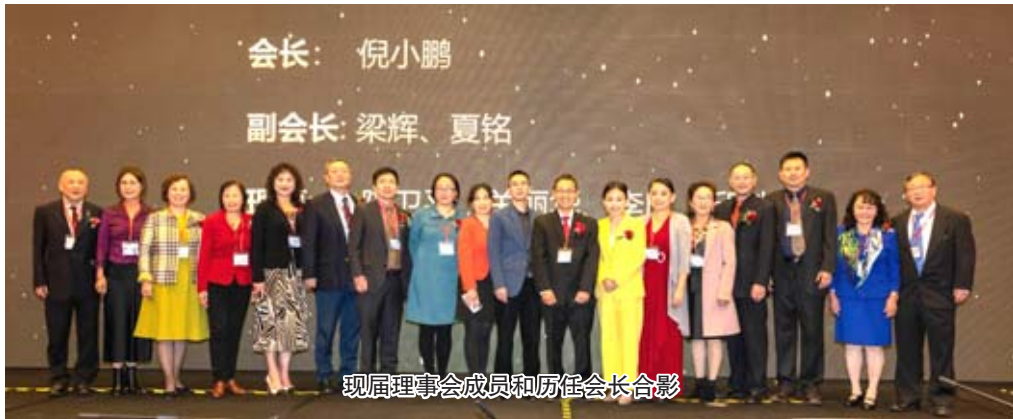
現屆理事會成員和前任會長合影