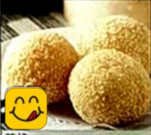
煎堆 Sesame Balls