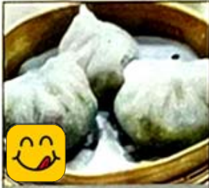
潮州粉果 Home Style Dumplings