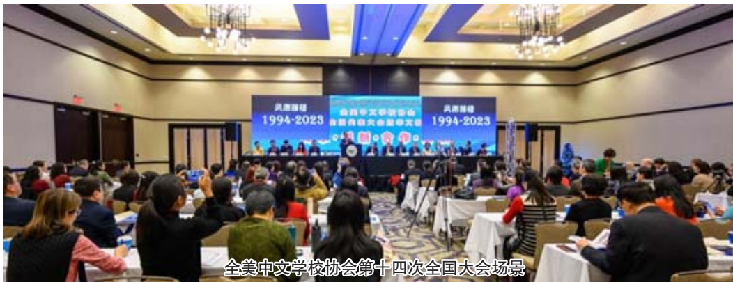
全美中文學校協會第十四次全國大會場景

『協會供稿』全美中文學校協會於2023年12月8日至10日在俄亥俄州哥倫布市成功舉辦了第十四次全國代表大會暨華文教育研討會。大會主題“傳承·創新·合作·發展”旨在深入探討美國華文教育領域的各個關鍵方面，特別關注後疫情時代的數字化轉型、線上線下融合、課程本土化、師資隊伍技能升級、教學內容和模式更新、多元社區建設等重要議題。這次盛會吸引了來自美國及全球各地的400多名會員學校代表、華文教育專家、以及華裔青少年，齊聚一堂，共同分享中文教育、文化傳承以及組織社區服務等方面的經驗與成就。