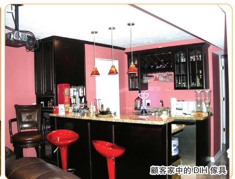
顧客家中的 DIH 傢具