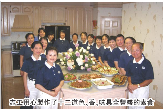
志工用心製作了十二道色、香、味俱全豐盛的素食

台灣盲人棒球隊「紅不讓」(Home Run)來克里夫蘭(Cleveland)參加由美國國家盲棒聯盟(National Beep Baseball Association (N.B.B.A.))舉辦的世界盃錦標賽;台灣盲棒是去年的冠軍,今年又被排為第一種子,備受注目。