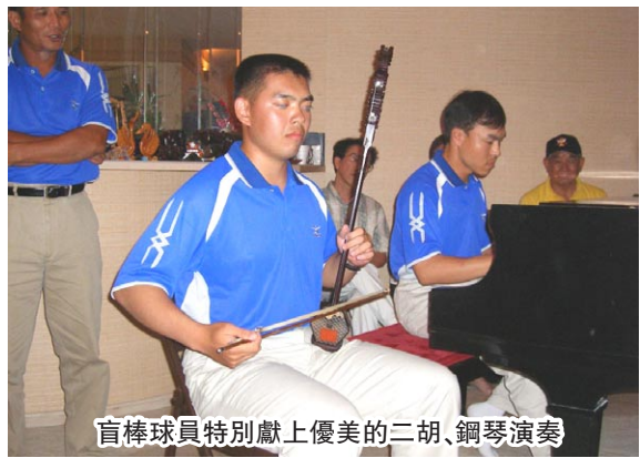
盲棒球員特別獻上優美的二胡、鋼琴演奏