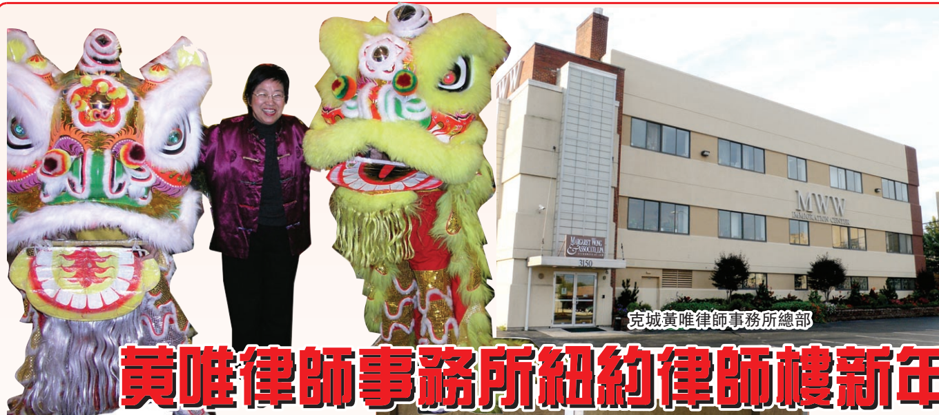
克城黃唯律師事務所總部

在1984年,在洛杉磯奧運會上奏響《義勇軍進行曲》的一代花劍名將樂菊杰,曾使億萬中國人為之流下熱淚,她拿到的金牌,也成為中國擊劍運動員唯一的紀念。她回國探親時看到祖國經濟突飛猛進,她高興,但也表現出了一絲擔憂,她希望我們不要丟掉過去純樸的一面。 既然是劍客,似乎最割捨不下的還是那充滿刺激的劍道,年輕的心緒就了樂菊杰又一個人的夢想,她有這樣的想往,作為隊員代表加拿大再戰2008年北京奧運會,這是樹立和變新的陳舊的觀念。這里我們贊賞樂菊杰的毅力和精神,華報衷心地祝福樂菊杰心想事成。