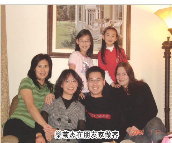
樂菊杰在朋友家做客 2007 1 14