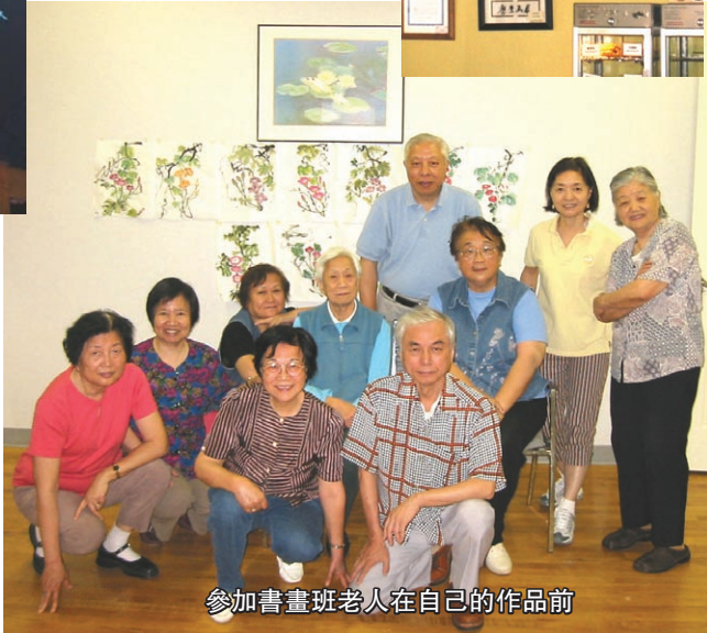
參加書畫班老人在自己的作品前